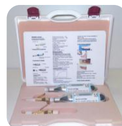
Maleta de presentación

Distintos aplicadores amplían las posibilidades. Campos de aplicación: Dermatología, Estética, Ginecología, Urología, Oncología, Proctología, Oftalmología, Medicina dental, Veterinaria, Cosmética y pedicura médica.