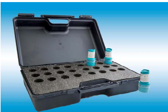
Maletin de transporte para 24 envases

Video demostrativo en www.biopsafe.com/spanish